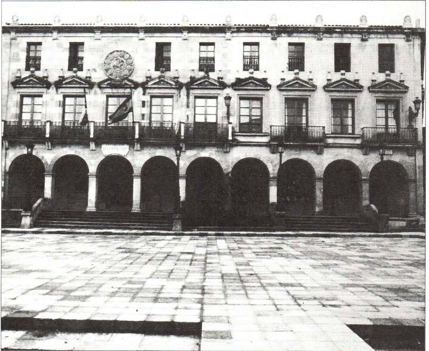
Casa troncal de los 12 Linajes. Soria.

A fines del siglo XVIII se vendió el teatro en pública subasta y fue comprado por don Florencio Peña, pasando a ser propiedad particular, edificándose entonces un Coliseum municipal 15 .