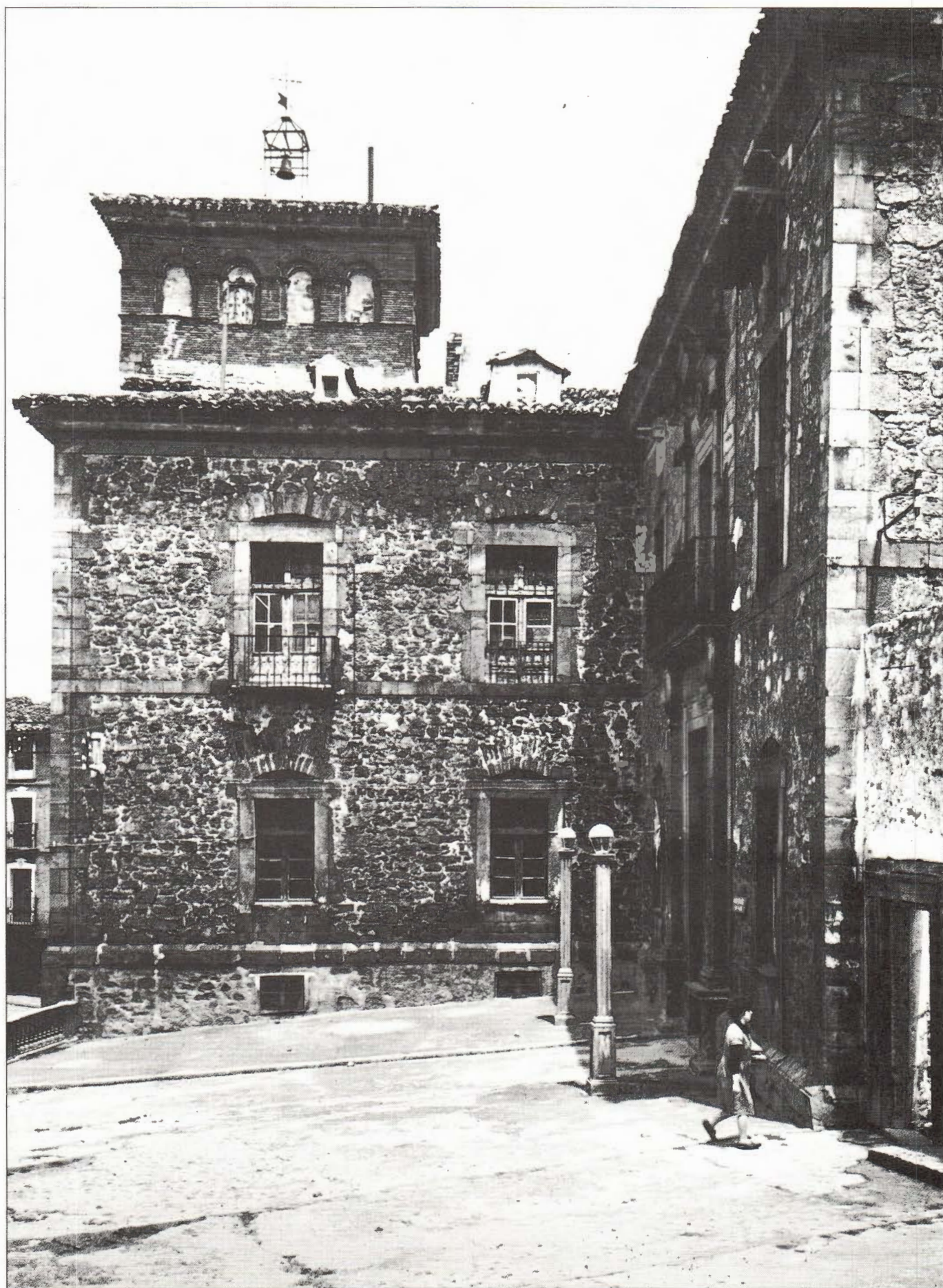
Agreda. Palacio de los Castejones.