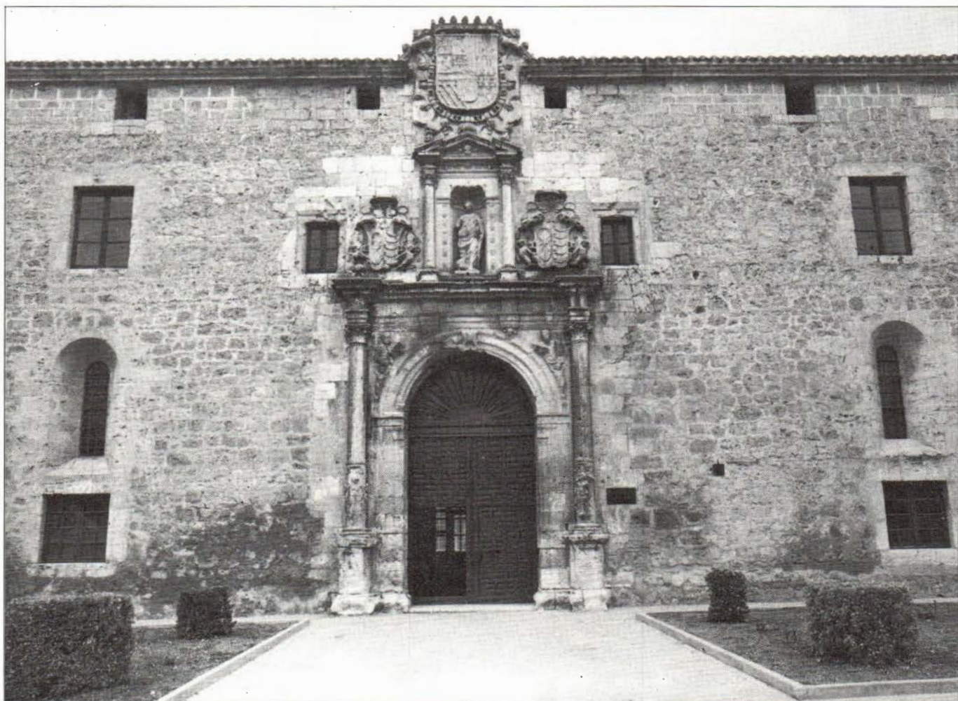
Universidad de Santa Catalina. El Burgo de Osma.

En Agreda en la cubrición del río con una bóveda y la construcción del Palacio Municipal, también sobre el río, supuso no sólo la unión de dos zonas de la villa, el barrio que ocupa la ladera sur del recinto amurallado junto a la iglesia de San Juan, con el «barrio Judío» del entorno de la Sinagoga y la Virgen de la Peña, sino la creación de un espacio cívico de gran calidad urbana, que más tarde se completaría al unificarlo con la cubrición del acceso a la Basílica de la Virgen de los Milagros. También en este siglo XVI, se construye el palacio de los Castejones junto a la puerta del Tirador y que configuran con los palacios góticos existentes y la iglesia de Yanguas, actualmente arruinada, la plaza del Castejón. Por último en el siglo XVIII se construye el palacio nuevo de los Castejones, el edificio más complejo y ambicioso de toda la villa, construido igualmente en su espacio de unión del «barrio moro» y los poco definidos «Judío y cristiano».