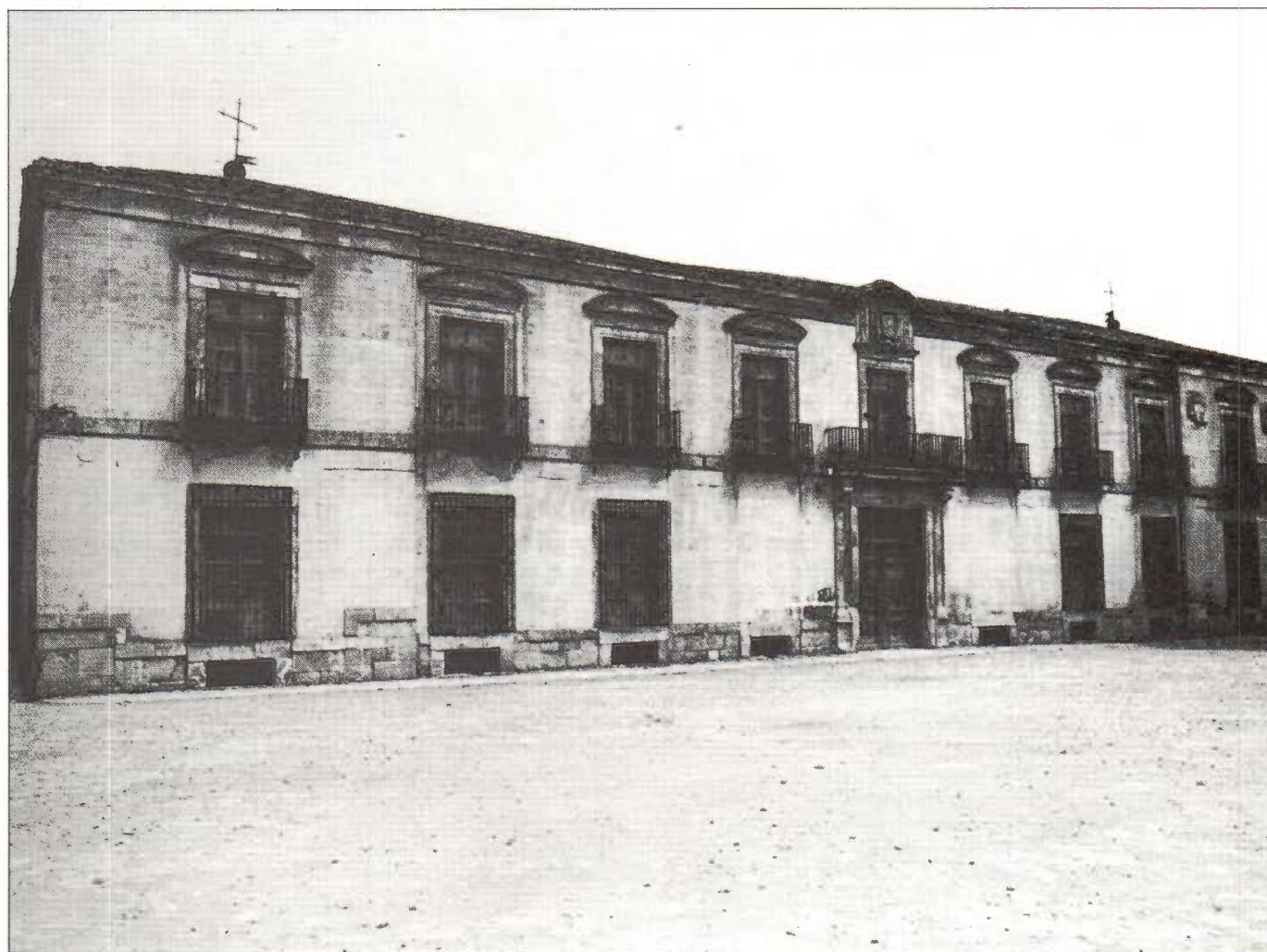
Palacio ducal de Medinaceli