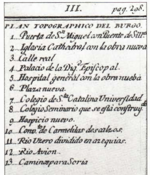
Plano topográfico del Burgo de Osma según J. de Loperraéz: Descripción custórica del Obispado de Osma

La arquitectura civil de los siglos XVI y XVII constituye en Soria, la mayor y más interesante aportación de edificios, tanto por su propia calidad arquitectónica como por el papel que desempeña para el desarrollo de la ciudad medieval anterior.