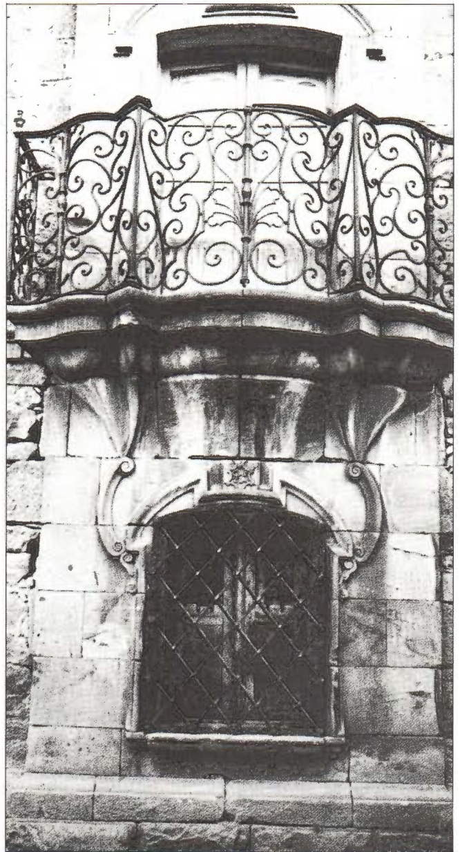
Palacio de la Media Naranja. Narros.