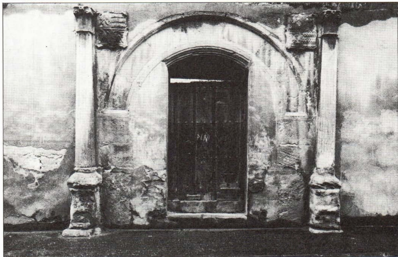
Soria. Portada en la calle Caballeros.