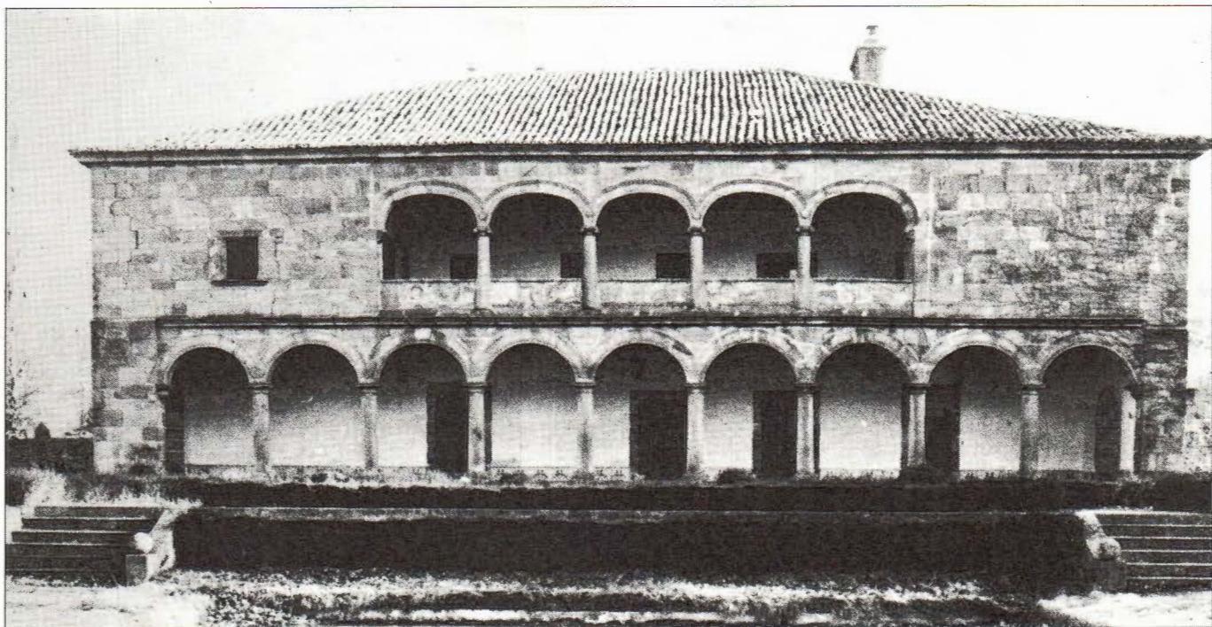
Palacio de los condes de la Puebla de Valverde. Hinojosa.