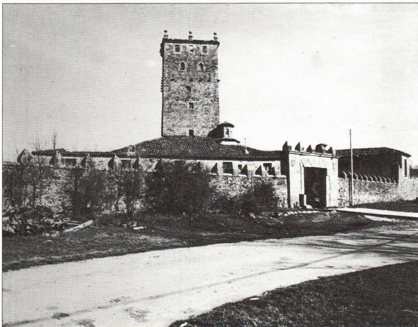
Palacio de Aldeaseñor.