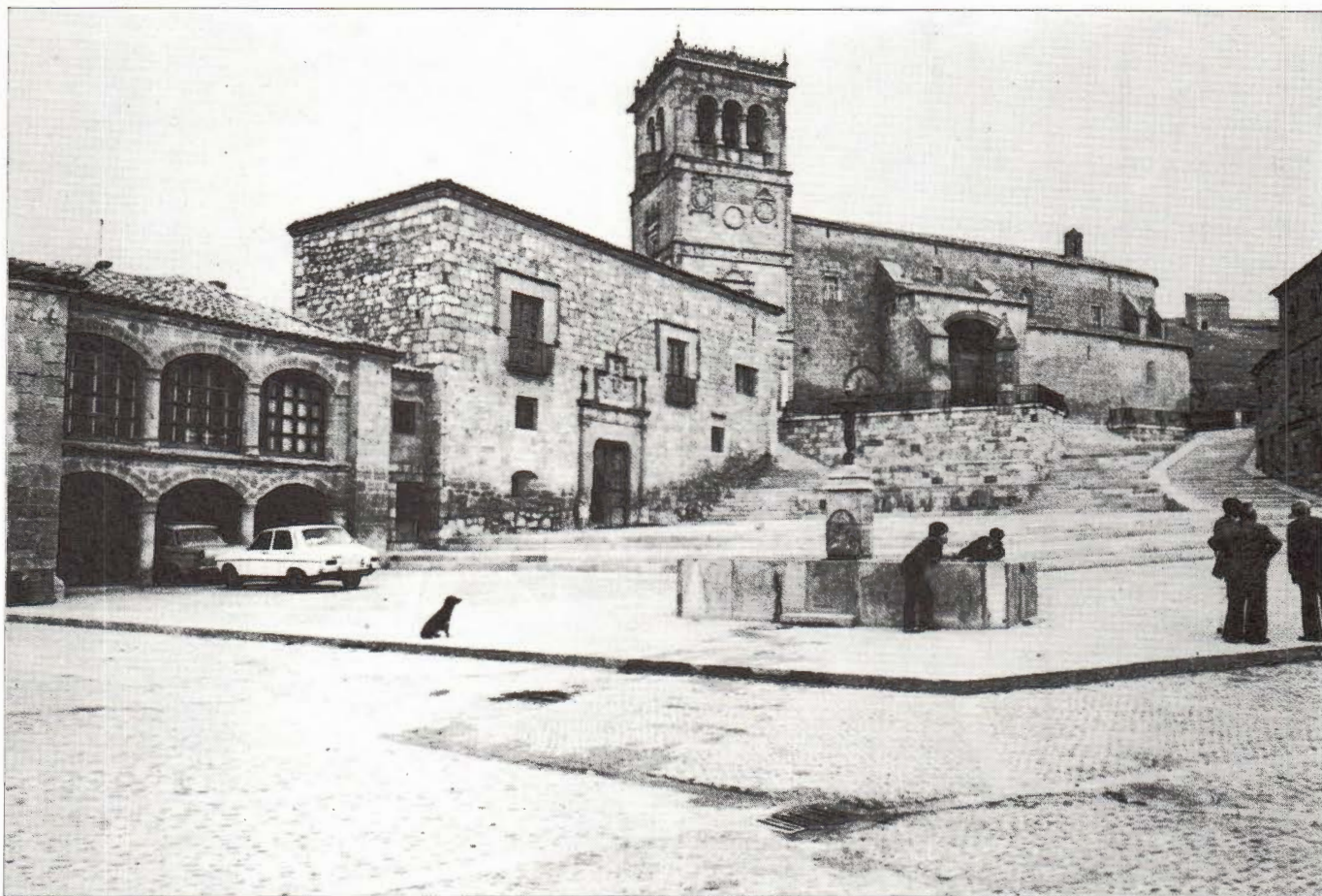
Plaza Mayor de Morón de Almazán.

En Medinaceli la construcción del Palacio Ducal a comienzos del siglo XVII supuso el cierre por uno de sus frentes de la Plaza Mayor, espacio de suntuosa amplitud frente a la compleja estructura urbana del resto de la villa, también en este siglo se reedifica la casa Ayuntamiento en la misma Plaza Mayor.