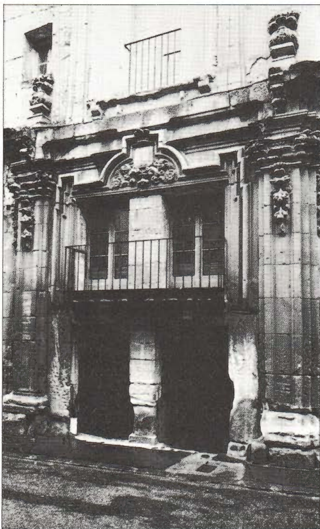
N.ºs 14 y 16 de la calle Caballeros de Soria.

Eran en general gentes de condición modesta y escaso nivel cultural, existiendo en Soria, dentro del oficio diferentes categorías como maestros, oficiales, aprendices, mancebos y peones. Tan solo los arquitectos, al parecer, conocían la obra de Vitruvio y Vignola. Entre estos últimos, no muy numerosos por cierto, algunos fueron incluso escultores y mazoneros como Gabriel de Pinedo y Roque Aragonés. Destacan entre otros, en la primera mitad del siglo Juan de Arce, Francisco de Revilla (familiar de la Inquisición), Martín de Solano, los García de la Hondal, los Marroquín etc., distinguiéndose Melchor de Bueras que llegó a ser arquitecto de las obras reales con Carlos II 2 . En la segunda mitad, tienen cierto interés, los Pérez de Villaviad y los Izaguirre, Julián y Domingo.