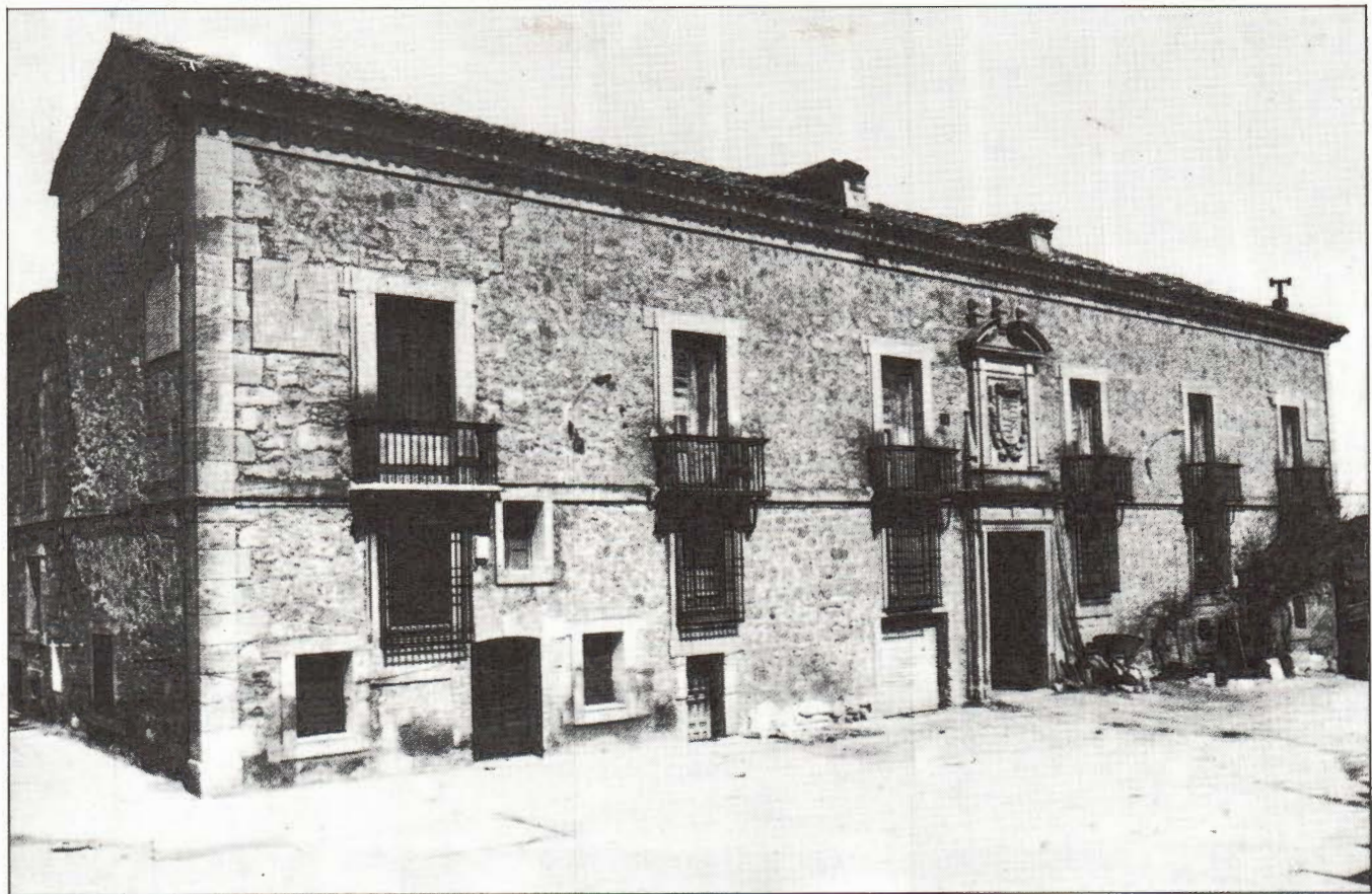
Palacio de Velamazán.